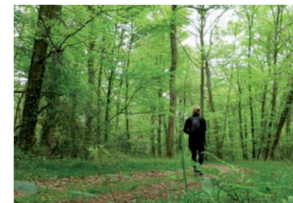
Dans le bois