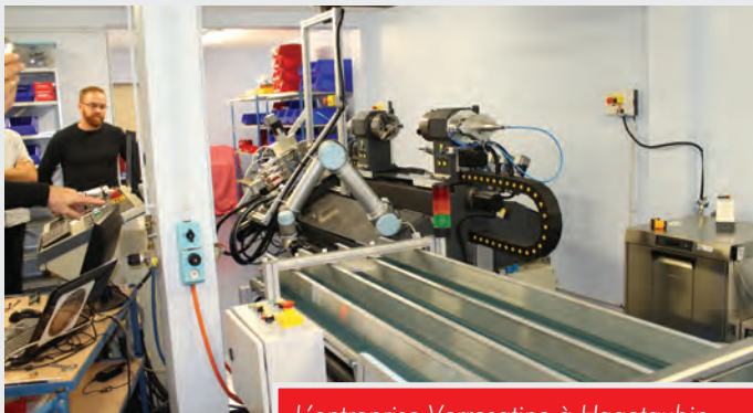
L'entreprise Verresatine à Hagetaubin, soutenue par la CCLO.