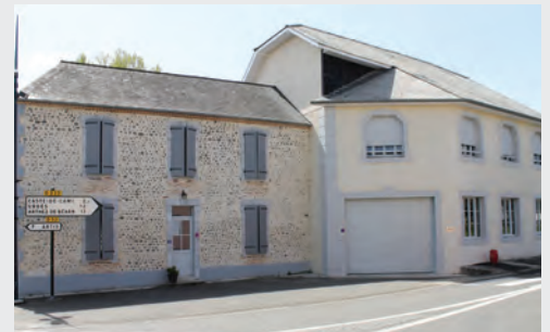
Cescou - Une rénovation réussie au coeur du bourg.