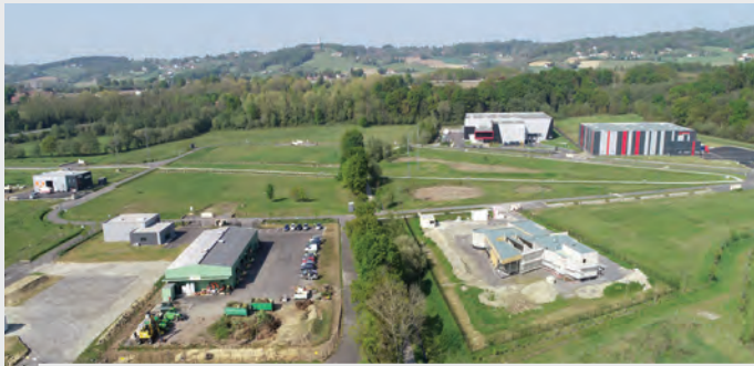
Eurolaçq 2 - Près de 17 hectares ont été vendus, ou sont sur le point de l'être, sur la zone d'activité Eurolaçq 2. Elle s'étend sur 29 hectares sur les communes d'Artix, de Labastide-Cézéracq et de Labastide-Monréjeau.

Pour l'accueil des entreprises sous-traitantes et artisanales, la CCLO propose des zones d'activité et de l'immobilier d'entreprise équitablement répartis sur l'ensemble du territoire.