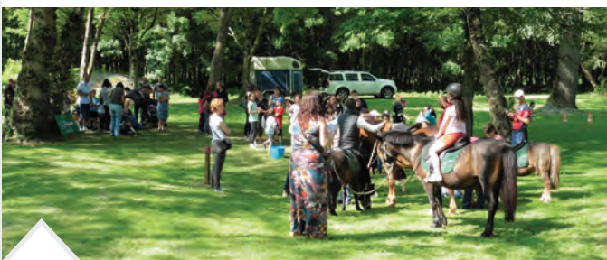
Fête du Lac à la base de loisirs d'Orthez-Biron - Depuis 2016 elle s'est imposée comme un rendez-vous incontournable pré-estival. Elle est le rendez-vous des familles dans un cadre champêtre et sécurisé.

En 2019, 2 marchés hebdomadaires d'approvisionnement en produits locaux se tiennent toute l'année en fin d'après-midi à Lacq et Argagnon. Ces marchés sont des vitrines de premier plan pour les producteurs locaux.