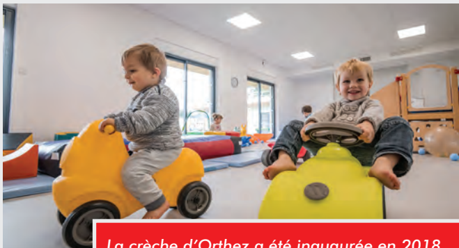
La crèche d'Orthez a été inaugurée en 2018.

* Ce fonds, prélevé par l'Etat, est constitué des ressources des intercommunalités et des communes. Il est reversé à des intercommunalités et des communes moins favorisées.