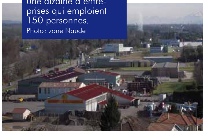
Photo : zone Naude

accueillent une dizaine d'entreprises qui emploient 150 personnes.